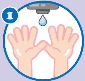
1 濕 しづ