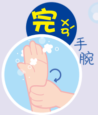
7 完 おわり 手腕 手首