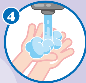
4 捧 もち