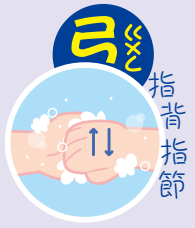
4 弓 ゆ 指背指節 指の背と関節