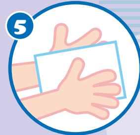
5 擦 すり