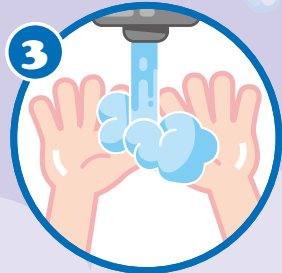
3 沖 すす