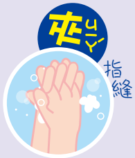
3 夾 はさ 指縫 指の間