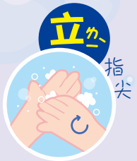
6 立 たて 指尖 指の先