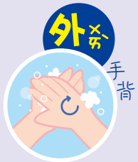
2 外 そと 手背 てのうら