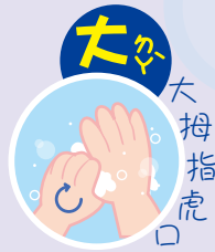
5 大 おほ 大拇指虎口 親指と手首