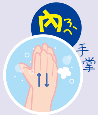
1 內 うち 手掌 てのひら